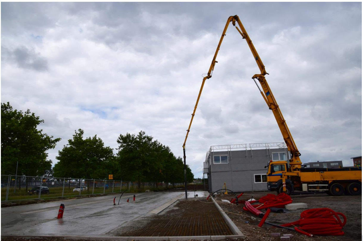
Storten van een voorziening.