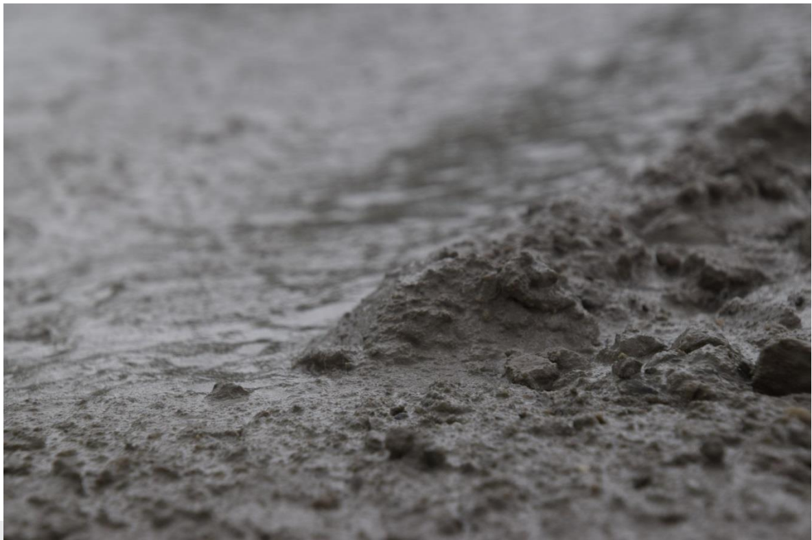
Foto: Detail betonmortel.