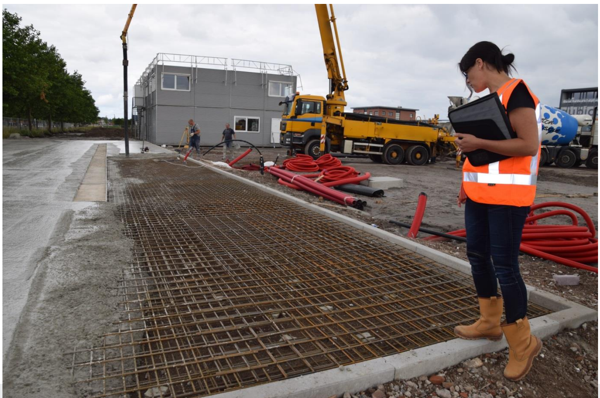
Foto: Kwaliteitscontrole van het werk

Ook bij herstel bepaalt de opdrachtgever door middel van een programma van eisen de criteria en controleert de aannemer vooraf of aan de gestelde eisen kan worden voldaan. Feitelijk is er in deze beoordelingsrichtlijn wat betreft werkwijze en systematiek geen verschil tussen aanleg en herstel van een vloeistofdichte voorziening.